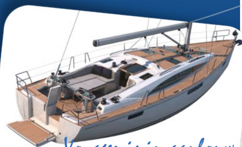
Voyager is in aanbouw