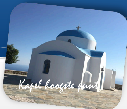
Kapel hoogste punt