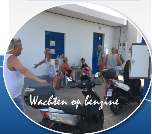
Wachten op benzine