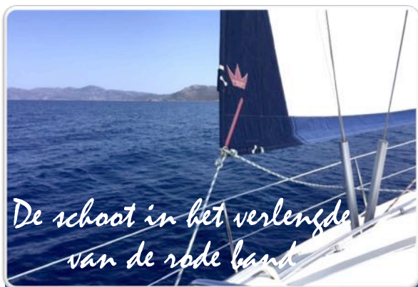
De schoot in het verlengde van de rode bank

In het vorige magazine hebben we de voorinschrijving al aangekondigd en er hebben al een behoorlijk aantal mensen gereageerd. De 2 landenroute wordt zeer positief ontvangen en wij vinden het dan ook erg leuk om zo veel positieve reacties van jullie te krijgen. Allereerst wordt de optie gelegd en na 1 november zullen we contact opnemen over de eventuele boeking. Dit geldt uiteraard voor het hele seizoen hoor, je hebt de gelegenheid om op alle routes een optie te leggen zodat je zeker bent van de boot van je keuze. Heb je nog geen mail ontvangen van Cees met de nieuwe prijzen en routes? Ze staan al op de website: www.sailbest.nl